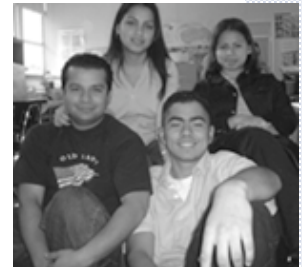
ABE/GED students, Mission Campus, CCSF.