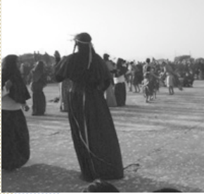
"Puma Indians dancing at dawn on Alcatraz..."